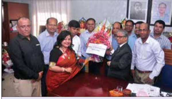
ঢাকা বিশ্ববিদ্যালয় ক্লাব