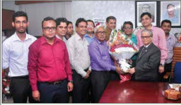
ঢাকা বিশ্ববিদ্যালয় বিজ্ঞান অনুষদ