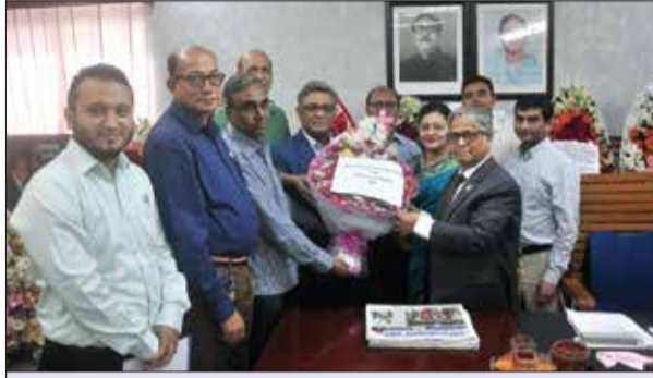
ঢাকা বিশ্ববিদ্যালয় আর্থ এন্ড এনভায়রনমেন্টাল সায়েন্সেস অনুষদ