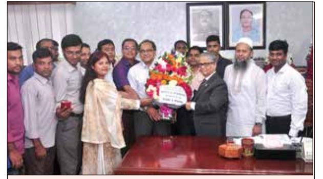
ঢাকা বিশ্ববিদ্যালয় কলা অনুষদ