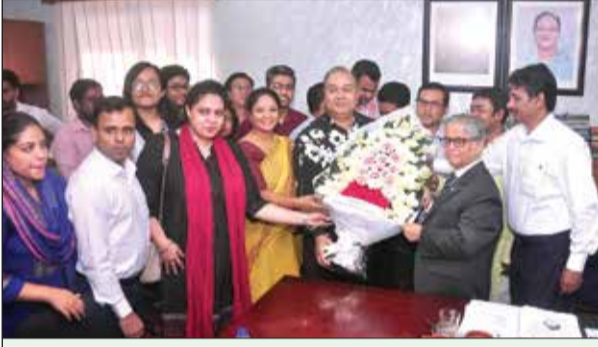
ঢাকা বিশ্ববিদ্যালয় বিজনেস স্টাডিজ অনুষদ