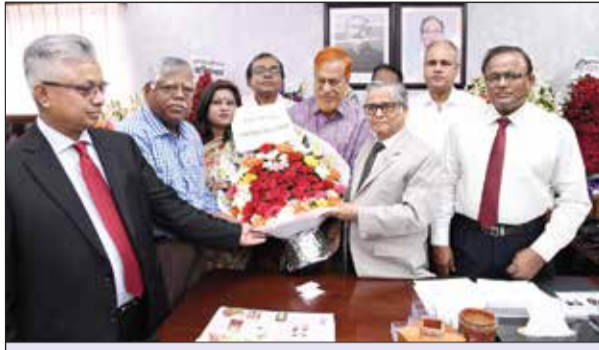
ঢাকা বিশ্ববিদ্যালয় সিনেট সদস্যবৃন্দ