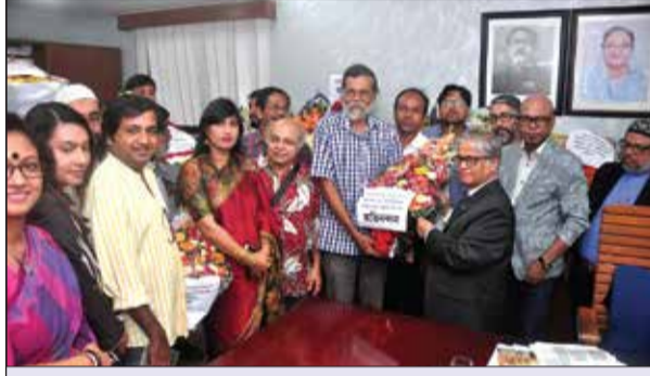
ঢাকা বিশ্ববিদ্যালয় চারুকলা অনুষদ