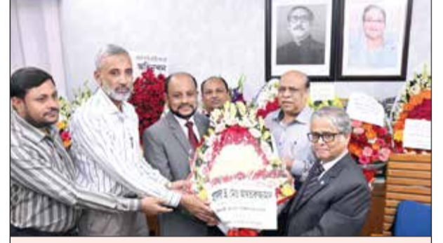
ইসলামিক আরবি বিশ্ববিদ্যালয়