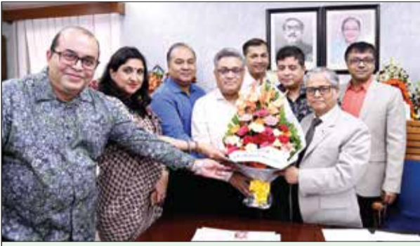
ঢাকা বিশ্ববিদ্যালয় শিক্ষক সমিতি