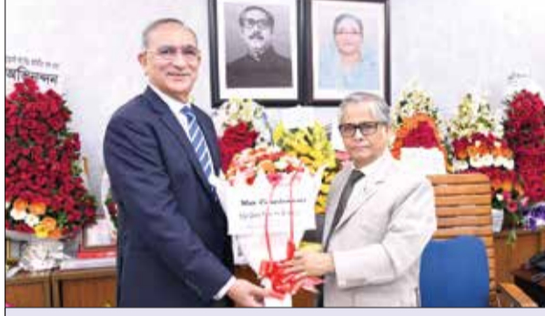
অধ্যক্ষ, হলি ফ্যামিলি রোড ক্রিস্ট মেডিক্যাল কলেজ