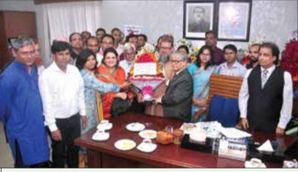
ঢাকা বিশ্ববিদ্যালয় ইসলামের ইতিহাস ও সংস্কৃতি বিভাগ