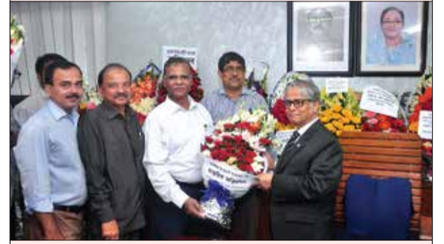
ঢাকা বিশ্ববিদ্যালয় জীব বিজ্ঞান অনুষদ