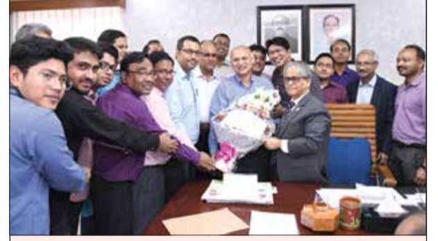
ঢাকা বিশ্ববিদ্যালয় চিকিৎসা অনুষদ